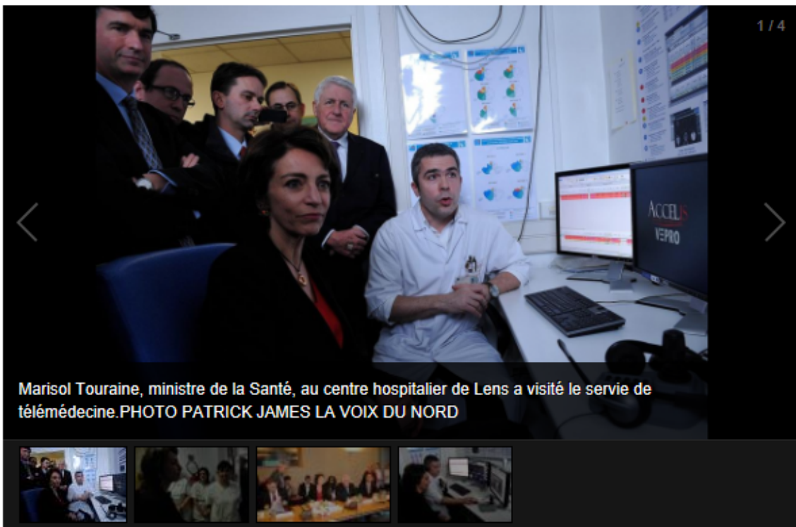
Marisol Touraine, ministre de la Santé, au centre hospitalier de Lens a visité le service de télé-médecine.

Une visite au sein d'un service du CH Lens, une réunion de travail, Marisol Touraine a optimisé son passage lensois, ce jeudi, avant de rejoindre Lille. Le ministre des Affaires sociales et de la Santé a confirmé la marche en avant du projet d'un nouvel hôpital.